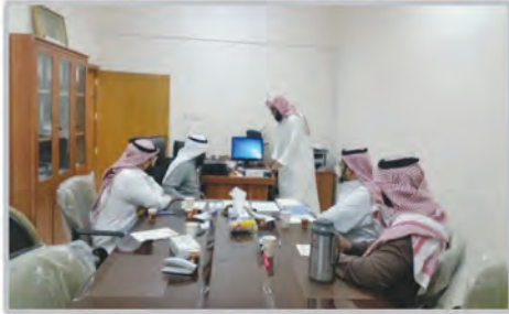
دورة تطويرية للمستشارين